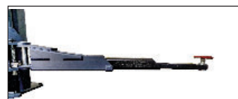
spezieller flacher Tragarm