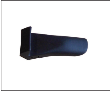
Kunststoffschutz für Montagebacken Art.-Nr. 500031560 (LMM11/16) Art.-Nr. 300010006 (LMM-17/18)