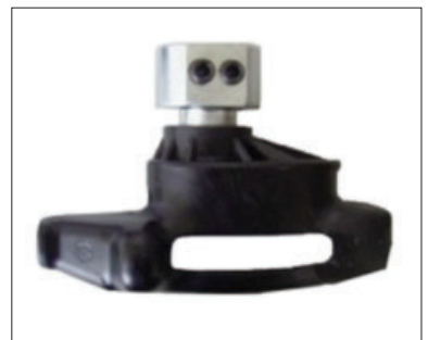
ST-4 Kunststoffmontagekopf Art.-Nr. 300010048