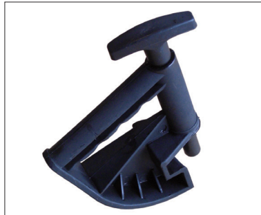
YT-A Wulstniederhalter Art.-Nr. 300010096