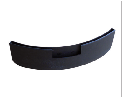
CT-A Kunststoffschutz für Abdrückschaufel, Art.-Nr. 300010088 Art.-Nr. 300010090 (LMM-MC1)