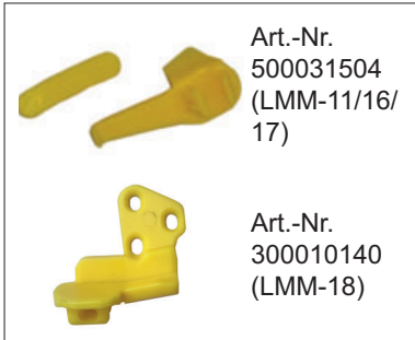
Art.-Nr. 500031504 (LMM-11/16/17)