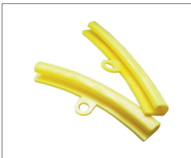
FS Felgenschutz universal Satz (= 2 Stück) Art.-Nr. 300010106