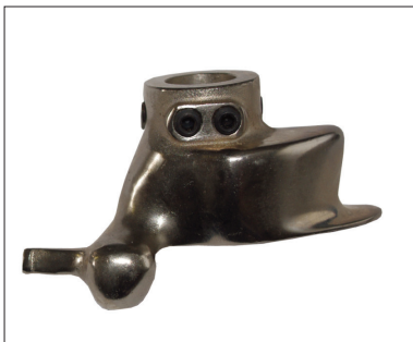
MC-4 Motorradmontagekopf Art.-Nr. 300010072