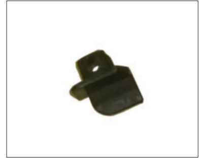
BT-4 Kunststoffeinsatz Montagekopf Art.-Nr. 300010066 (LMM-MC1)