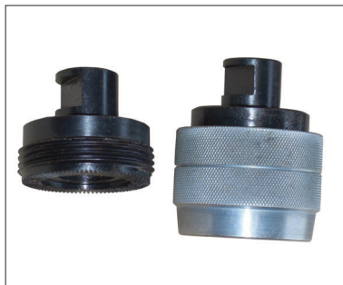
KH Schnellwechselsystem für Montageköpfe Art.-Nr. 300010104