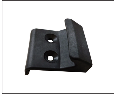
Kunststoffschutz für Montagebacken/Spannklauen Art.-Nr. 300010003 (LMM-MC1)