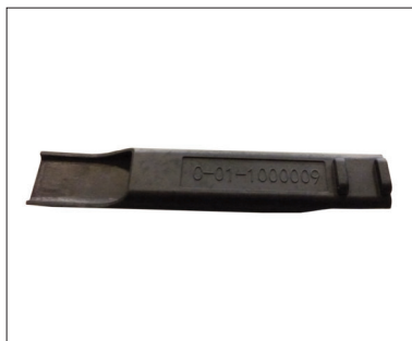
QT-20 Kunststoffschutz für Montiereisen Art.-Nr. 300010032