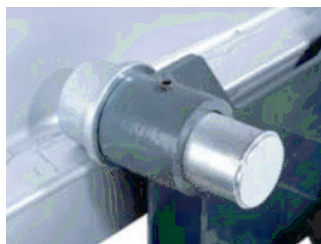
nadelgelagerte Rollen, verstellbare Achsbolzen