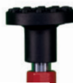
Tragteller mit Gummiauf-lage rund