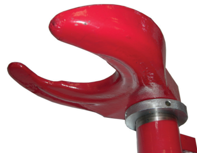
Arretierung für untere Federaufnahme