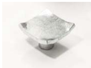
LP-PST Pratte diverse Ausführungen