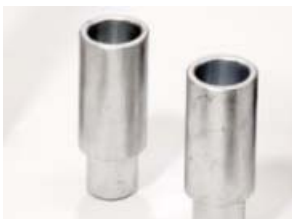
LP-HV Zwischenstücke zur Hubverlängerung